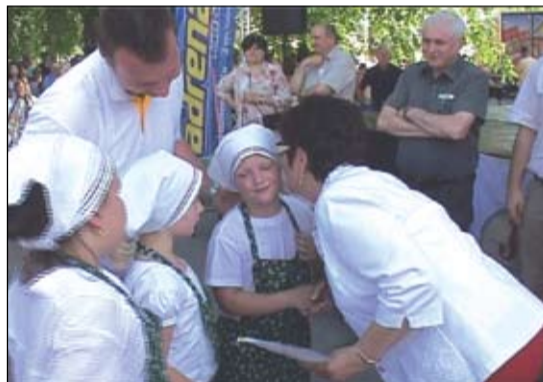
Az iskolások több csapattal készítettek kiváló ételeket. Az Izsáki Házitészta Kft. valamennyi gyermekcsapatot díjazta