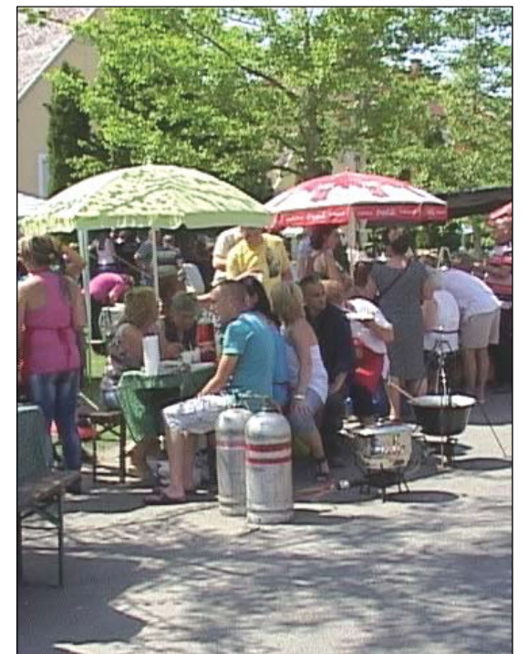
Három hosszú sorban főttek a bográcsokban a finom ételek