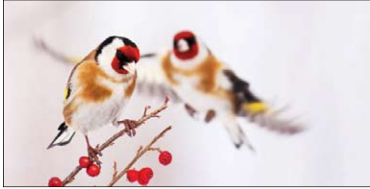
„Adj helyet magad mellett”