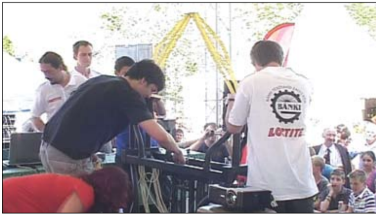
A tésztahidak teherbíró képessége ismét elkápráztatta a közönséget