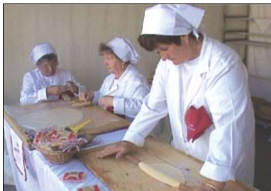
A kiskunfélegyházi és kunszállási asszonyok idén ismét bemutatták a hagyományos házitészta készítés fortélyait