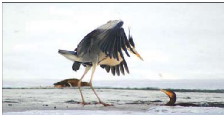
„Harc az utolsó falatért”