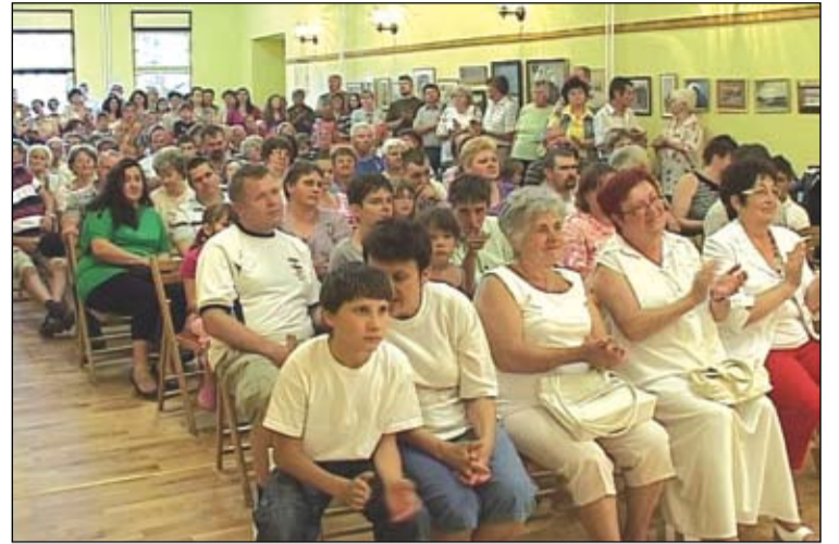
A felújított művelődési házból nagy tömeg nézte meg a kiállításokat és az iskolások avató műsorát