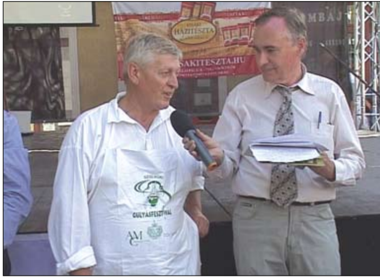
Csányi Sándor: „Izsák tavalyi szolnoki bemutatkozása igazi nagy siker volt. Ezt nem udvariasságból mondom. Sok város mutatkozott már be a Szolnoki Gulyásfesztiválon itthonról és külföldről is, de akkora sikert, mint az izsákiak még senki nem aratott”.