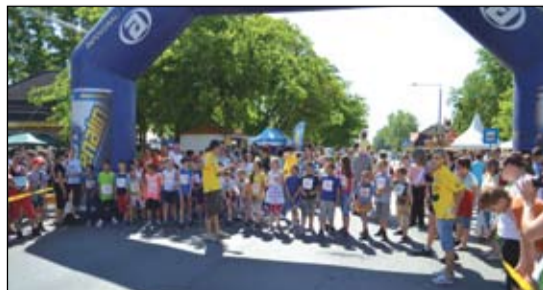
Az V. Kolon Kupán valamennyi kategóriában és korosztályban sokan álltak rajthoz, köztük számos izsáki versenyző is