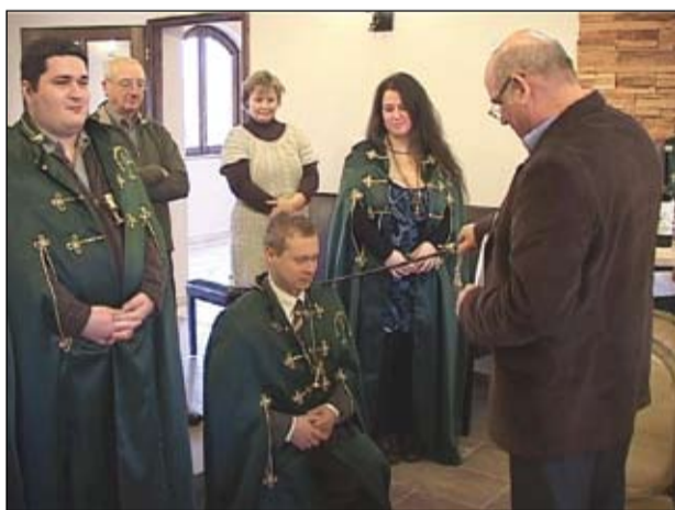
Az új borlovagok avatása