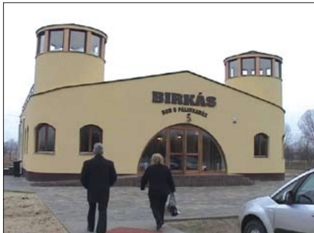
A Birkás Bor és Pálinkaház az 52-es út mellett várja a vendégeket