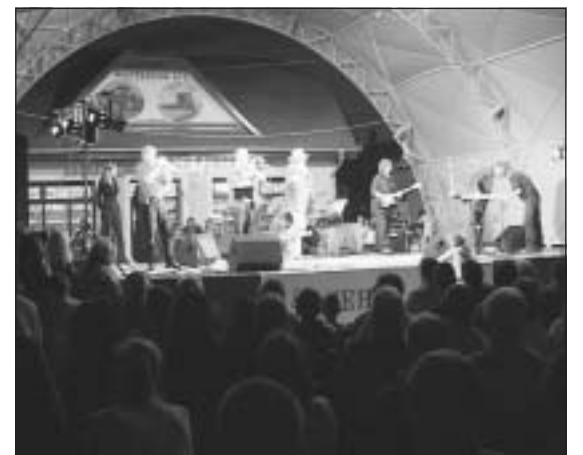
Az új helyen felállított színpad programjai sok érdeklődőt vonzottak a három nap során