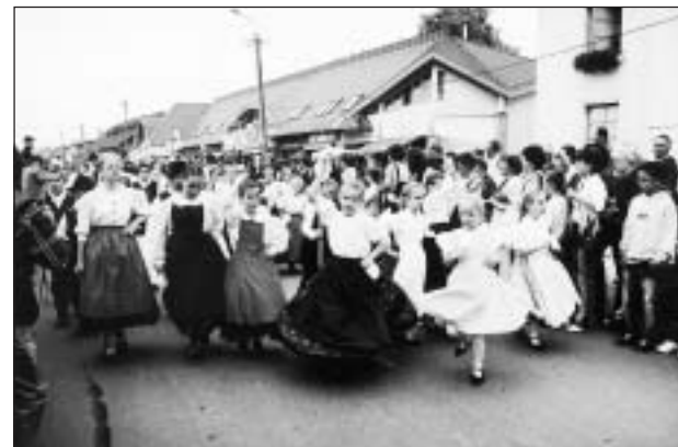
A vasárnapi felvonulás -a néptáncosokkal, mazsorettekkel, a strullendorfi fúvósokkal, fogatokkal, lovasokkal és motorosokkal (utóbbiak több mint háromszázan voltak)- igen látványosra sikerült, melyet idén a jakabszállási repülősök jóvoltából még légi bemutató is színesített.