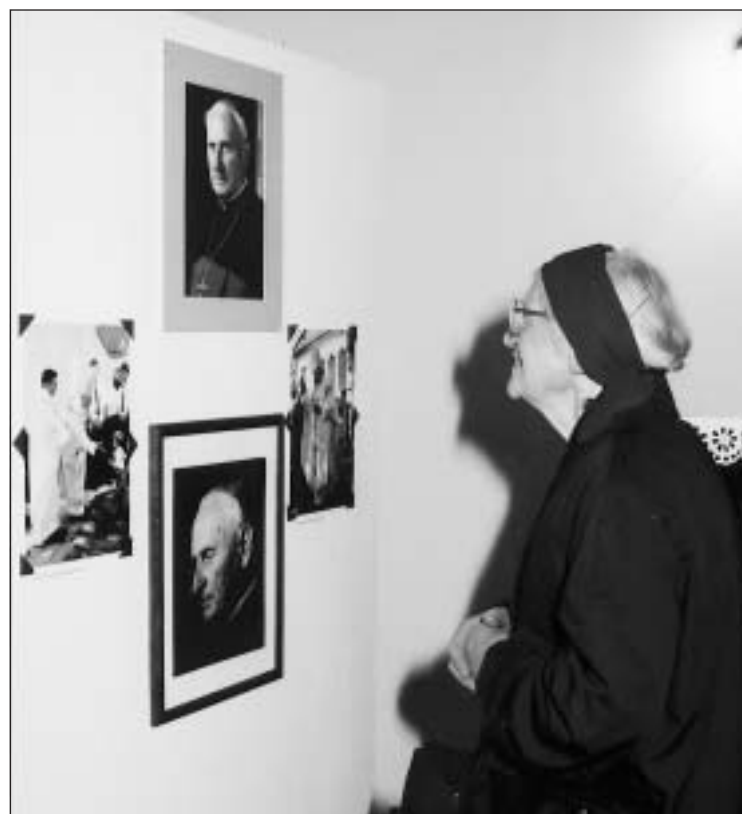
A kiállítások hagyományosan a városházán, az ipartestületben és a gazdakörben várták a látogatókat, akik szép számban fel is keresték a helyszíneket.