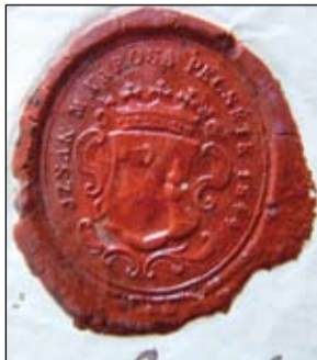
Izsák első városi viaszpecsétje, magát a pecsétnyomót a múzeumból ellopták...

Sajnos sem a kérelem előkészítéséről, sem a császári döntés dokumentumaiból nem sikerült semmit fellelni kutatásaink során, így csupán a várossá válás tényét tudjuk felemlíteni a kerek évforduló kapcsán. Városunk történetéből azt is tudhatjuk, hogy a városi rangot az 1867-es kiegyezés utáni intézkedések kapcsán elvesztettük, mivel az 1876-os közigazgatási átszervezés után községgé minősítették vissza Izsákot, s Pest-Pilis-Solt-Kiskun Vármegyéhez csatolták. Ezt