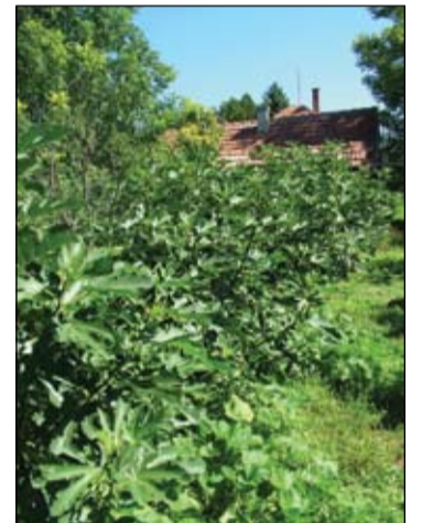
Fügebokor sorok az izsáki kertben

Mint nyugdíjas kezdett fügetermesztésbe, mert mint mondja szakemberként még inkább látja azt, amit a laikusok is észrevesznek, hogy a klímaváltozás egyre inkább kedvez a mérsékelt égövi fügefajták hazai termesztésének. Első fügefáját, - amely mostanra budapesti házuk udvarának jó részét beárnyékolja, s „melleslegesen” évtizedek óta adja a kiváló termést -, kis cserpes csemeteként vásárolta. Ennek fejlődését figyelve döntött úgy, hogy szülei izsáki házában kertjében komolyabb fügetermesztésbe kezd. Jelenleg négy fajta fügefája van, melyek különböző nagyságú fák és bokrokként növekednek a kertben. A növények fejlődésével a termés is egyre több, így már nemcsak saját fogyasztásra jut, hanem a barátok, ismerősök is